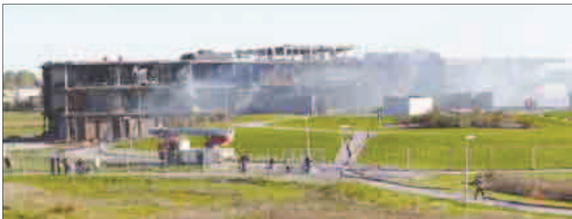
De afgebrande school van Gravenburg.

Ze missen heel erg hun vrienden. En ze vinden het heel leuk op de Anne Frank school Maar ze missen hun andere school wel.