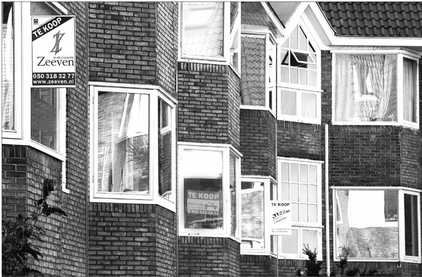
De stad kent een forse stijging van het aantal te koop staande woningen.