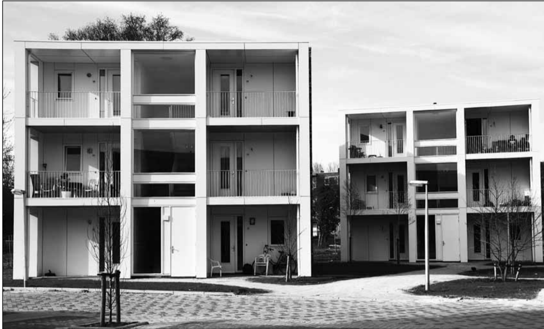
De ogenschijnlijk lukrake opstelling van twee kubusvormige bouwblokken aan de Bonairestraat bewerkstelligt een dynamisch uitstraling.

De onderste steen boven heeft oog voor architectuur in de stad Groningen. Niet voor prestigieuze grootschalige projecten, want daar wordt al genoeg over geschreven. Wel voor de kleinschalige krenten in de pap, die bij het grote publiek minder bekend zijn. Maar daarom niet minder de moeite van het beschouwen waard.