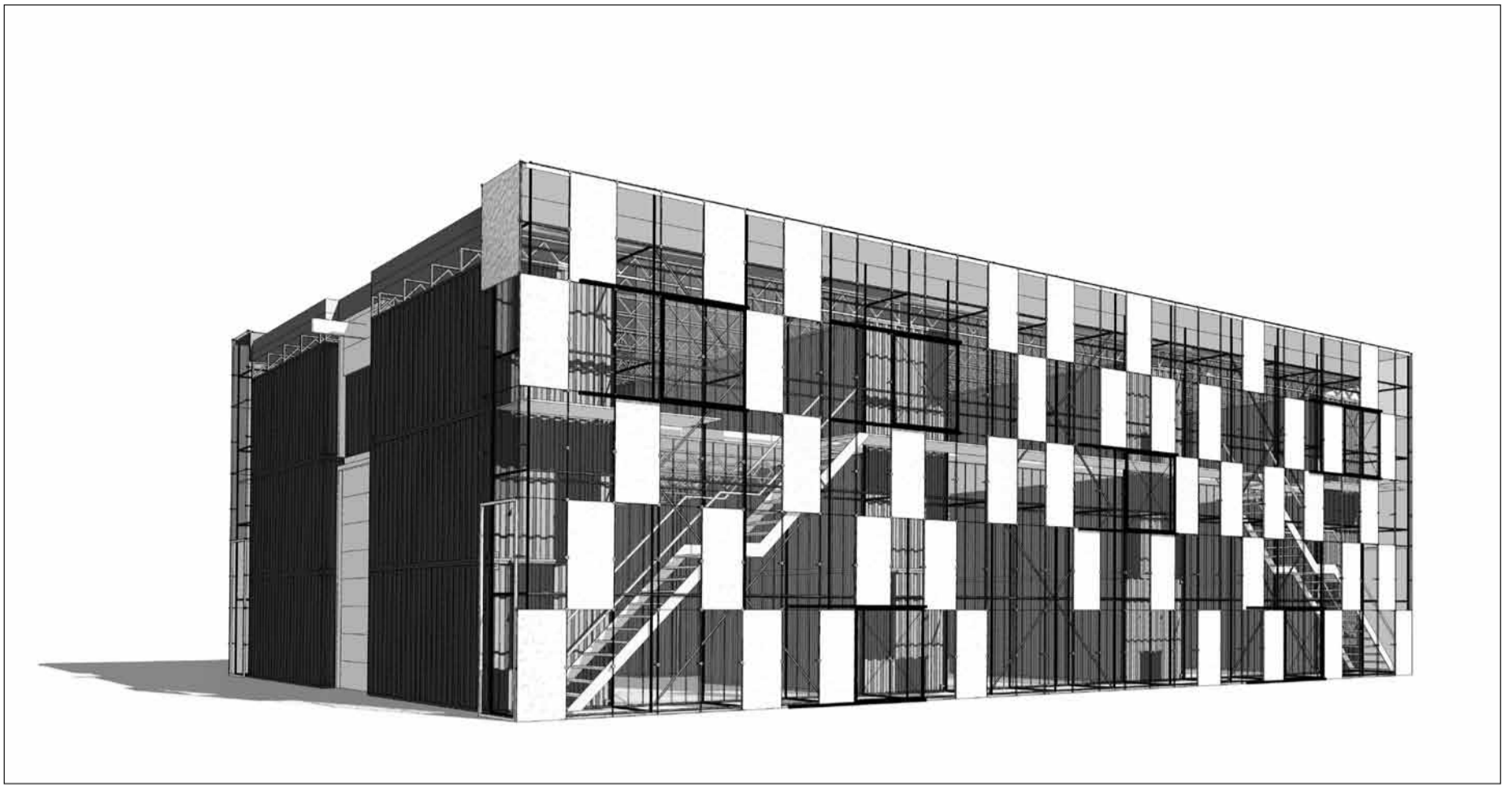
Het tijdelijke gebouw met atelierruimte voor twaalf kunstenaars. De bouwpanelen in de gevel zijn gemaakt van biopolymeren uit aardappelzetmeel.