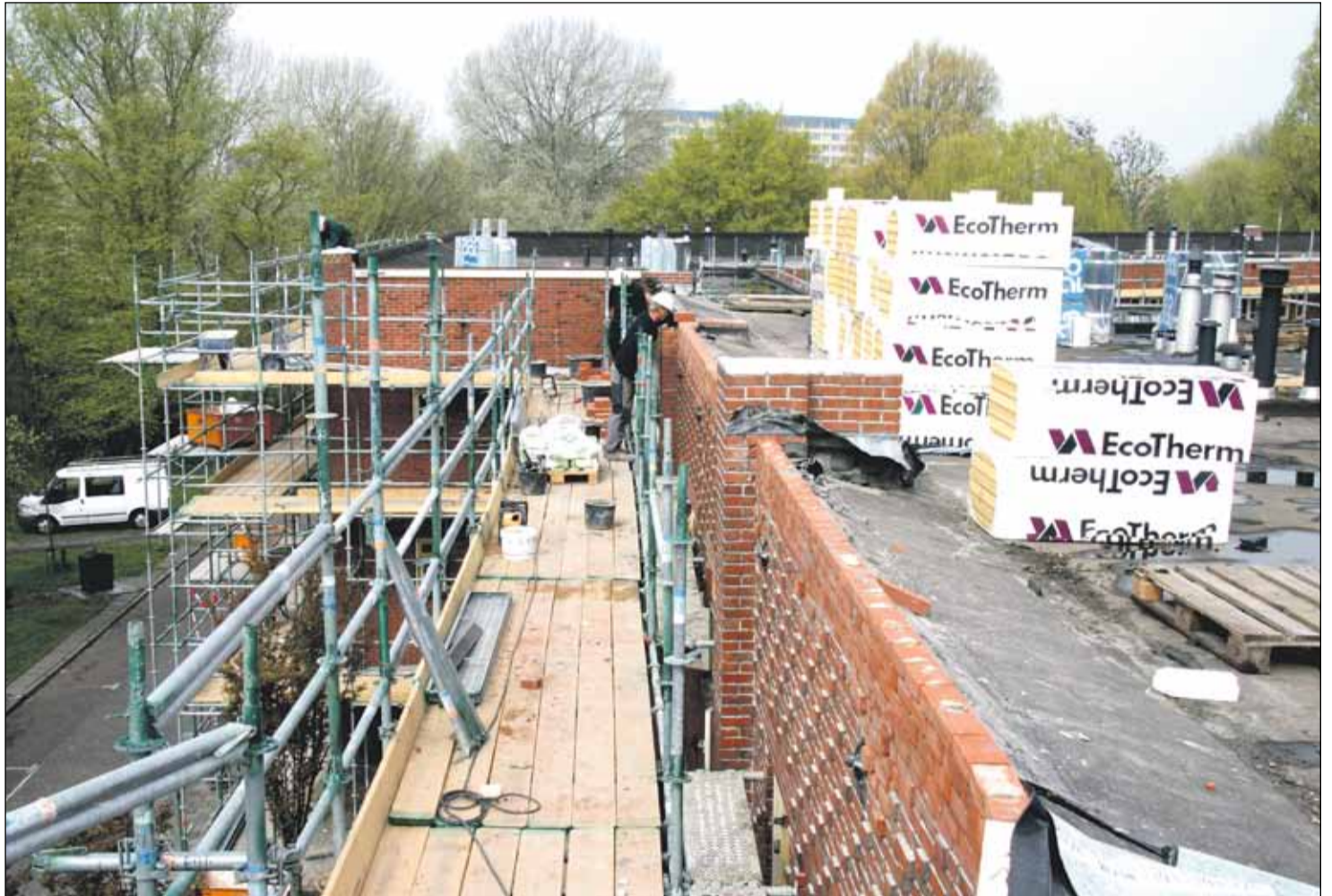
Duurzame woningverbetering op De Hoogte.